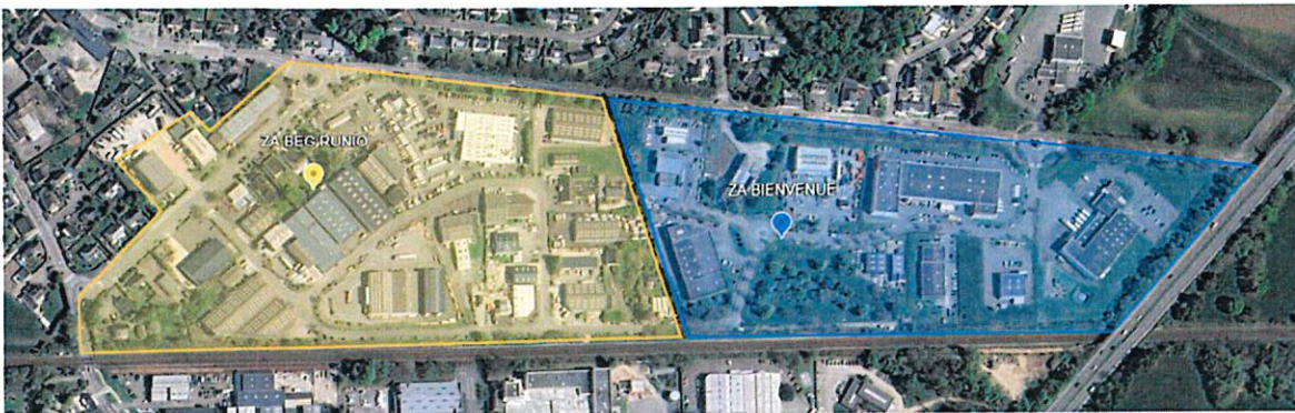
Organisation actuelle des zones

Par ailleurs afin de renforcer la lisibilité et l'unité de ces espaces économiques, il est proposé de ne retenir qu'une seule dénomination " Zone d'activité de Beg Runio" pour l'ensemble du périmètre regroupant les deux zones suivant le plan ci-dessous: