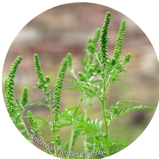
Ambrosie à feuilles d'armoise