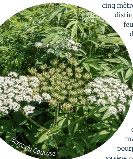
Berce du Caucase

Face à ces espèces invasives, la vigilance reste essentielle. Il est conseillé d'éviter tout contact direct, de ne pas manipuler les plantes sans protection et de signaler leur présence aux collectivités ou aux structures compétentes afin de limiter leur propagation. Reconnaître ces espèces constitue la première étape pour protéger à la fois la santé humaine et l'environnement.