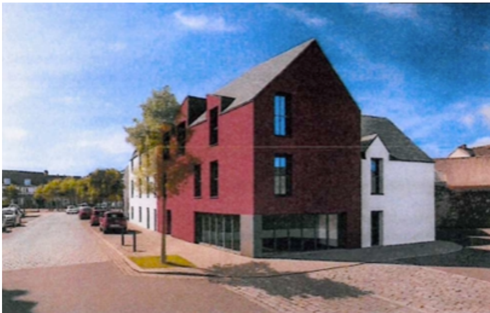
Insertion graphique du projet Morbihan habitat.

Le projet envisagé après démolition de l'existant propose un collectif de 11 logements sociaux et d'un local d'activité en rez-de-chaussée. Il sera implanté en front de rue pour respecter la continuité urbaine. L'ensemble proposera les stationnements règlementaires en bordure et dans la partie sud du terrain.