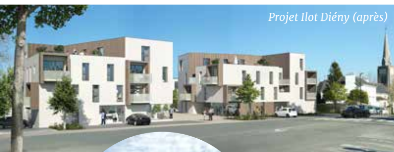
Projet Ilot Diény (après)

L'État, la Région Bretagne, l'Établissement Public Foncier de Bretagne et la Caisse des Dépôts et Consignation ont lancé en 2017 un appel à candidatures pour soutenir les projets d'aménagement portés par les communes qui réinventent leur centre-ville. Ils souhaitent encourager la réalisation d'aménagements structurants et innovants. Parmi les 208 projets présentés, le jury a décidé d'en soutenir 60, dont celui de la ville de Quéven, doté d'une aide de 931 242 €.