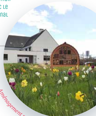
Aménagement paysager de l'îlot Mairie