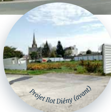
Projet Ilot Diény (avant)