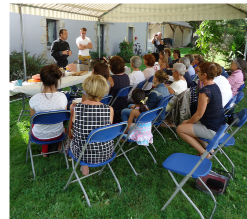
Atelier cuisine dans le jardin de la médiathèque

Alors, plus d'hésitation ! Venez vous ressourcer dans ce lieu situé à deux pas de chez vous.