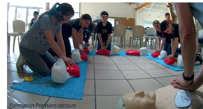
Formation Premiers secours