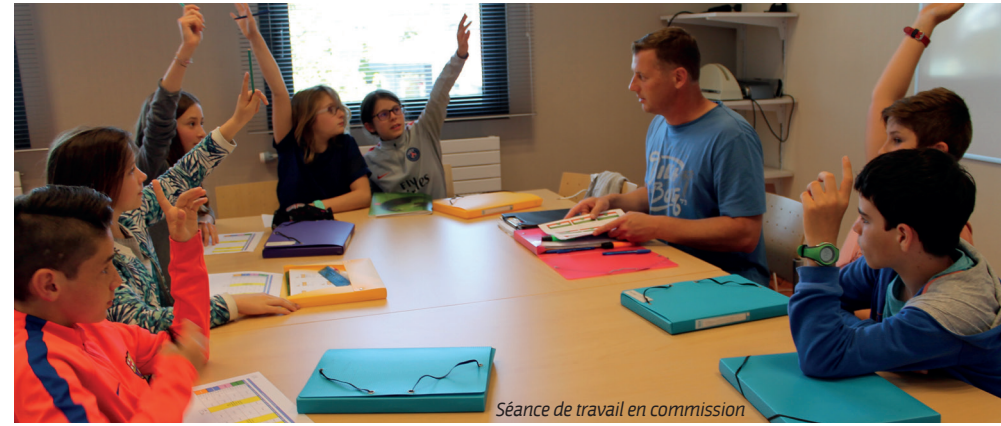
Séance de travail en commission

À l'automne prochain, les élèves de CM1 et CM2 des écoles de Quéven seront informés sur les futures élections du CME et auront la possibilité de s'y présenter comme candidat.